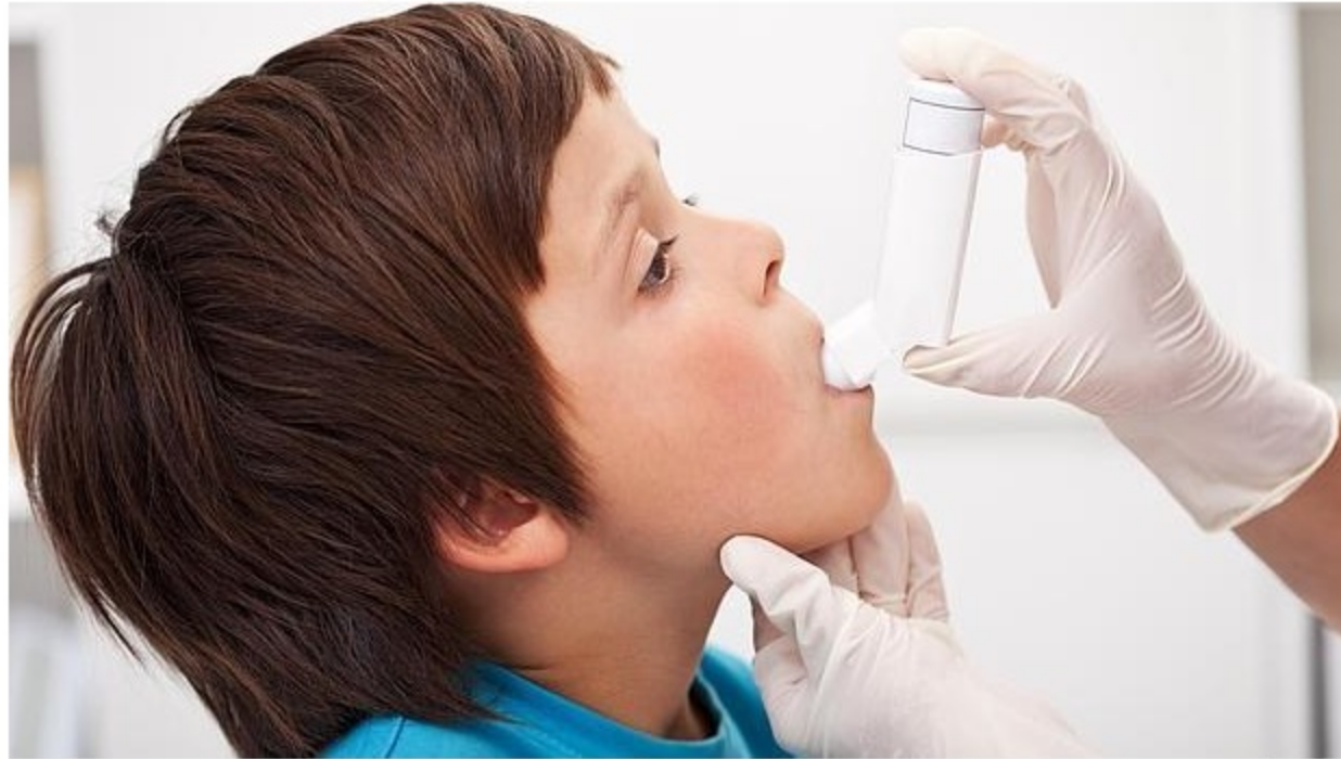
Un niño con el inhalador para asmáticos