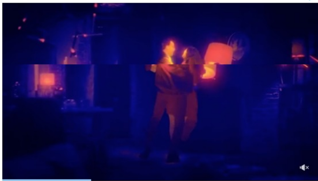
inRead invented by Teads

Son datos del artículo 'Prevalencia de la Enfermedad Pulmonar Obstructiva Crónica en el Área Sanitaria de Mérida en la población de 40 a 80 años en 2015', que ha recibido el premio al mejor artículo publicado durante 2018 que concede la Asociación de Neumólogos del Sur ( Neumosur ).