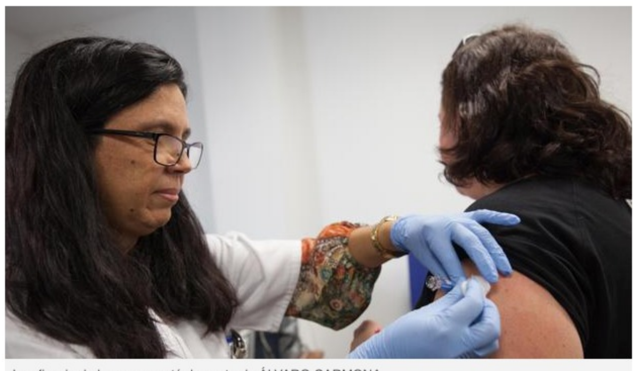
La eficacia de la vacuna está demostrada ÁLVARO CARMONA

Neumosur recuerda su eficacia ahora que el frío es inminente